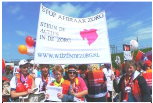
Vrouwen in de zorg strijden tegen afbraak zorg!

De dag tegen geweld tegen vrouwen is één van de gemeenschappelijke internationale strijddagen die in 2011 zijn afgesproken op de Wereldvrouwenconferentie van basisvrouwen in Venezuela: “Op 25 november, de dag tegen het geweld tegen vrouwen, strijden wij tegen alle vormen van geweld tegen vrouwen. In het bijzonder klagen we het geweld aan, dat het gevolg is van de imperialistische agressies en oorlogen tegen de volkeren, waarin de vrouwen tot slachtoffers en oorlogstroeën worden gemaakt.”