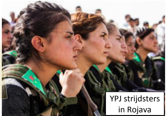
YPJ strijdsters in Rojava

Een andere toekomst, een beter bestaan Weg met de oorlog, vrouwen vooraan!