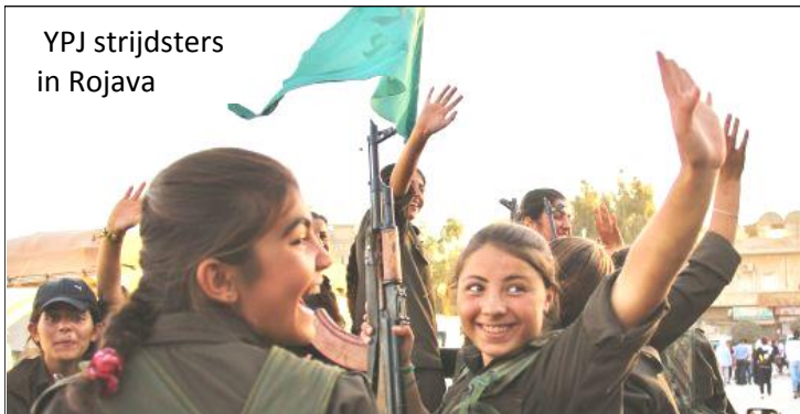
YPJ strijdsters in Rojava

zullen actief de solidariteit organiseren.