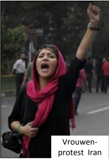
Vrouwen- protest Iran

De Internationale dag voor uitbanning van iedere vorm van geweld tegen vrouwen - 25 november - werd in 1981 door Latijns-Amerikaanse en Caribische vrouwen die strijden voor vrouwenrechten, uitgeroepen ter herinnering aan de moed van de zusters Mirabal uit de Dominicaanse republiek. Deze zusters - de drie vlinders - werden verkracht en vermoord vanwege hun strijd tegen dictator Trujillo en staan symbool voor verzet tegen de dictatuur.