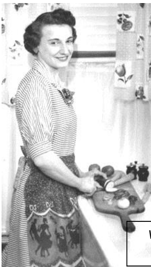
Vrouwen niet terug naar het aanrecht!

gaan daarbij de vrouwen in de zorg en de schoonmaak voorop. Vrouwen strijden tegen uitbuiting en onderdrukking en voor een toekomst voor jongeren.