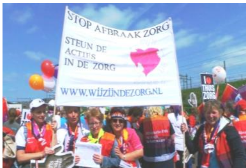
Vrouwen in de zorg strijden tegen afbraak zorg!

De dag tegen geweld tegen vrouwen is één van de gemeenschappelijke internationale strijddagen die in 2011 zijn afgesproken op de Wereldvrouwenconferentie van basisvrouwen in Venezuela: “Op 25 november, de dag tegen het geweld tegen vrouwen, strijden wij tegen alle vormen van geweld tegen vrouwen. In het bijzonder klagen we het geweld aan, dat het gevolg is van de imperialistische agressies en oorlogen tegen de volkeren, waarin de vrouwen tot slachtoffers en oorlogstroeën worden gemaakt.”