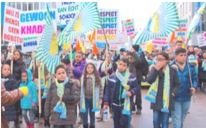
Schoonmaak in actie

Internationale Vrije Vrouwen Stichting, Wereldvrouwenconferentie afdeling NL, Koerdische Vrouwen Stichting Helin, Yeni Kadin, SKB-Socialistische Vrouwen Unie NL, ACCR-Vrouwen Commissie, Rode Morgen vrouwen, Vrouw en Bijstand - EVA, Makibaka, Women's Committee for Filipino Women and Children, CPI Komala vrouwen, 8 March Women's organisation (Iran-Afghanistan), ATKB-Vereniging van vrouwen uit Turkije in Amsterdam, FNV Bondgenoten Schoonmaak, HTIB-Turkse Arbeidersvereniging in NL en alle vrouwen die bij de voorbereiding helpen.