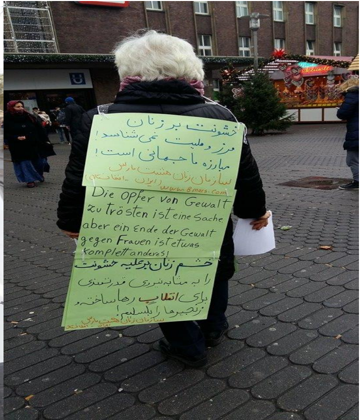
سازمان زنان هشت مارس (ایران - افغانستان) دوسلدورف